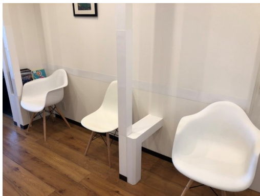
(椅子の距離を確保)

ソーシャルディスタンス（社会的距離）確保の徹底。原則、待合室に患者さんが同時に複数人とどまらないようにいたします。複数人とどまる場合は、患者様のお車でお待ちいただくようお願いしています。